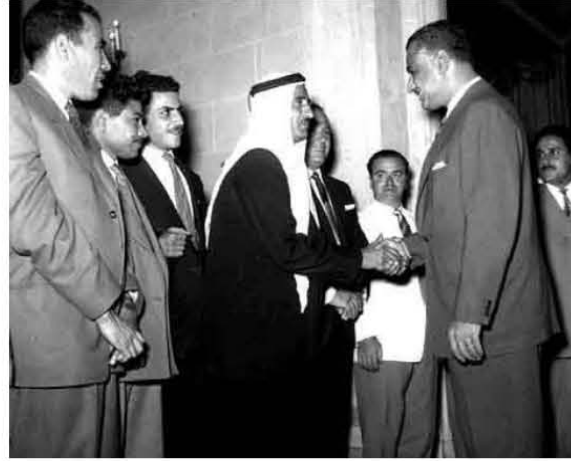
استقبال عبد الناصر لوفود العمال العرب ١٩٥٩/٤/٢٩